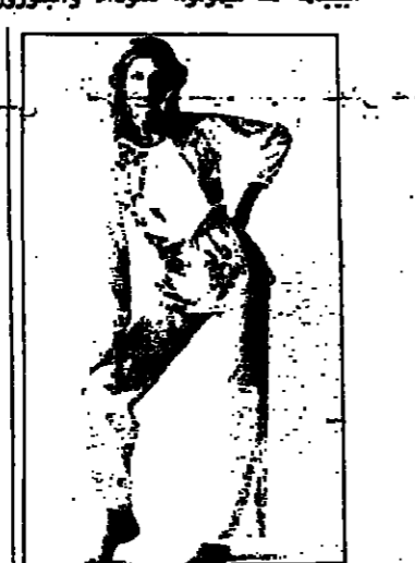
من عند رازوريل، زي نوم ابيض مرقع عند الصدر والخصر زائر رفيع يقف من الجيب، رمادية وعلى الجيب الحرف الجول من اسك.

لانكاسية قد تؤدي به الى غير رجمة والطريف في الامر، ان الذي ينقص «الاجينز» وبيرد ان يخلط محله ليس اكثر من.. قبيس نوم! لكن هذه القوية النسائية، ليست